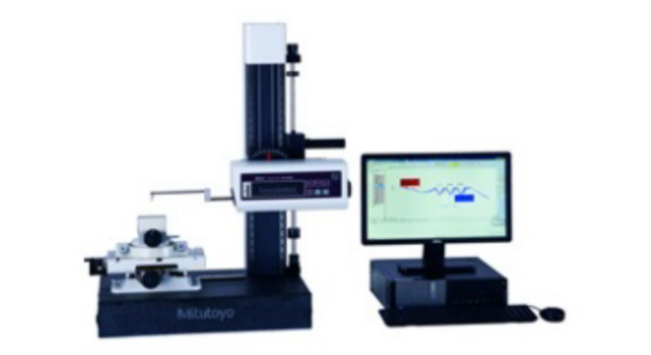
PERFILOMETRO MITUYOYO CV-3200H4

Disponemos de una sala climatizada destinada a conservar todos los dispositivos de medición a una temperatura constante de 20 °C y una tridimensional Mitutoyo para mediciones muy exigentes.